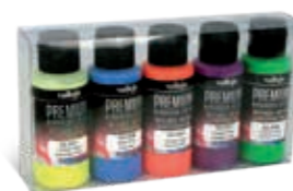
62.102 Fluo Colors Colores Fluo