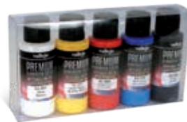
62.101 Opaque Basics Básicos Opacos