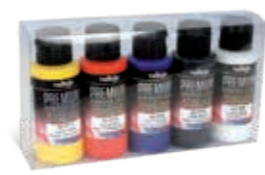
62.104 Candy Colors Colores Transparentes

DE Premium Color, spritzfertig die Airbrush angemischt, ist eine vielseitig verwendbare Farbe auf Wasser Base. Die Farben, für alle Oberflächen geeignet, sind gift-frei, speziell formuliert für eine hervorragende Haftung auf Metall, GFK, Polyethylen, klare Lexan Polycarbonat, Slot-Car und RC-Karosserien, und alle Tuning -und Auto-Grafik-Anwendungen. Für beste Ergebnisse auf schwierigen Untergründen empfehlen wir zuerst eine Grundschicht mit Polyurethan-Primer (62.061) aufzubringen. Premium-Farben sind flexibel und äußerst langlebig und verblassen auch nach längerer Zeit nicht; die Farben behalten ihre Leuchtkraft und Glanz auch bei Witterungseinflüssen.