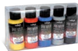
62.103 Metallics Metalizados